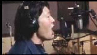
POETIC ASSASSIN „Inverti in Darkness“