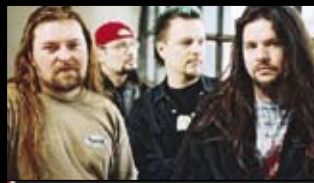
ŠKWOR „Mý slzy neuvidíš“

„Tu mač brad in maj bedrum, tu mač braaaaaad.“ U nás tohle sice není nijak populární virál, ale když jsem tohodle japonského metaláka objevil, mělo jeho zásadní video Inverti in Darkness asi 30 tisíc vjůs. Dneska mu chybí 100 tisíc do rovnýho milionu, čímž předěčí i některý klasiky žánru a pomalu nastupuje cestu, kterou mu vyšlapal PSY se svým populárním tanečkem. Nikdy mě neprestane fascinovat, jakěj zápal pro věc z videa přímo tryská. Nikdy mě neprestanou fascinovat zpěvákovy kěrky (na předloktích například něco blížící se Mickey Mousovi, na druhym klasická kostička Misfits). A nikdy mě neprestane fascinovat k dokonalosti dovedenej text o mytí rukou po japonskym masakru motorovou pilou. X