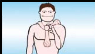
DO YOUR BALLS HANG LOW