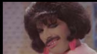
QUEEN - „I WANT TO BREAK FREE“ Universal International Music BV, 1984

Tak toudle triádou bych uzavřelo dnešní veřejnou zповěď. Tenhle majštrýtky za-bil hned třikrát. Film, ústřední píseň a následný oficiální videoklip k ní. Sagí je mistr, Lukáš Vaculík má nejcív svetry (a zařtly džiny), parta kámošů nejen do deště stojí vždycky na správný straně a Karel Augusta je ten nejluxusnější bad boy v historii český kinematografie. Zápletka jak prase, akce střídá humor, nakonec nesmrtelnej riff a posezení na perónu u garáží Flora. Mluvím samozřejmě o prvním dílu, druhý byl tragédie a vstupy Vašuta mi zkazily nadhled. Už se těším na další mejdan s jukeboxem o čtvrté ráno. Dávej ber, kurva! X