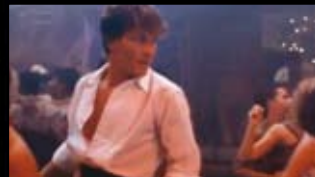
DIRTY DANCING Romantický / Drama / Hudební USA, 1987