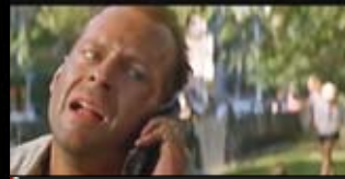
DIE HARD Akční / Thriller USA, 1988