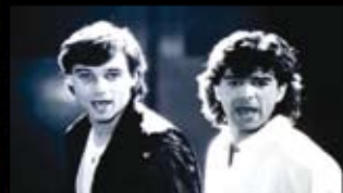
KAMARÁD DO DEŠTĚ Komedie / Krim Československo, 1988